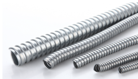
MC型金属软管 Metal Flexible Conduit