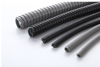
MCR型金属软管 Metal Flexible Conduit